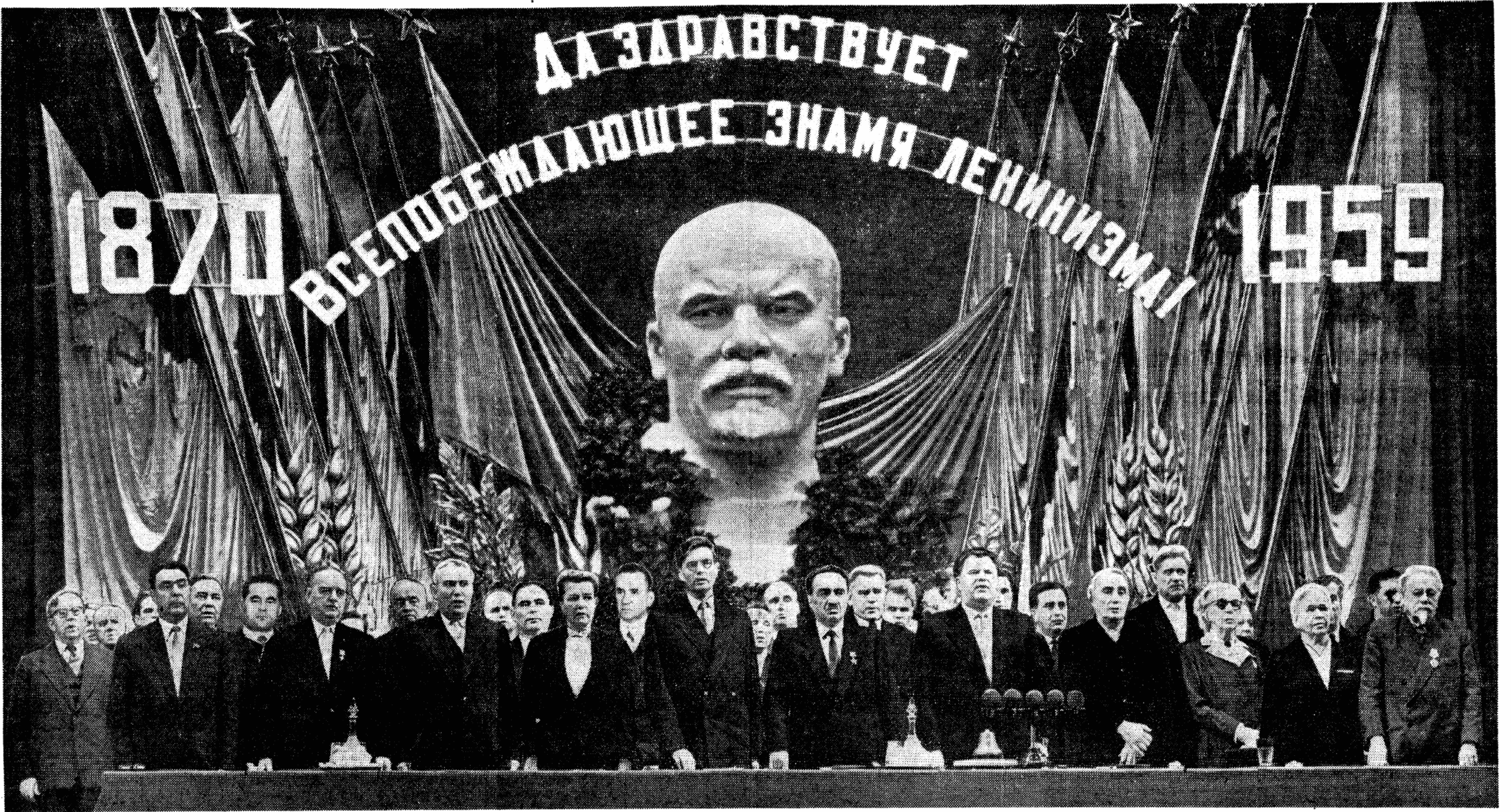
Москва, Большой театр СССР. 22 апреля 1959 года. Президиум торжественного заседания, посвященного 89-й годовщине со дня рождения Владимира Ильича Ленина.

Под знаменем марксизма-ленинизма, под руководством Коммунистической партии — вперед, к победе коммунизма! Да здравствует коммунизм — светлое будущее всего человечества!